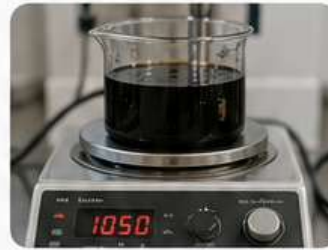
اختبار نقطة التلين ASTM D36