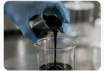
فحص الكثافة ASTM D70