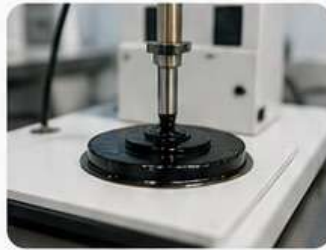
اختبار الاختراق ASTM D5

يتم فحص كل دفعة من المنتج في معاملنا المتخصصة لضمان مطابقتها للمواصفات القياسية.